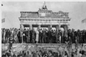
1. La chute du mur de Berlin

Histoire : Quelques temps forts du XXe siècle en France, en Europe et dans le monde (6 points)