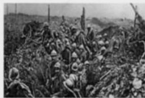
4. La Première Guerre mondiale