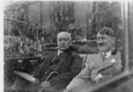
5. L'arrivée d'Hitler au pouvoir

1. Situez les événements sur la frise chronologique ci-dessous, en reportant le numéro correspondant dans la case. (2,5 points)