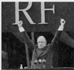
3. La naissance de la Vème République