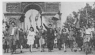
2. La libération de la France